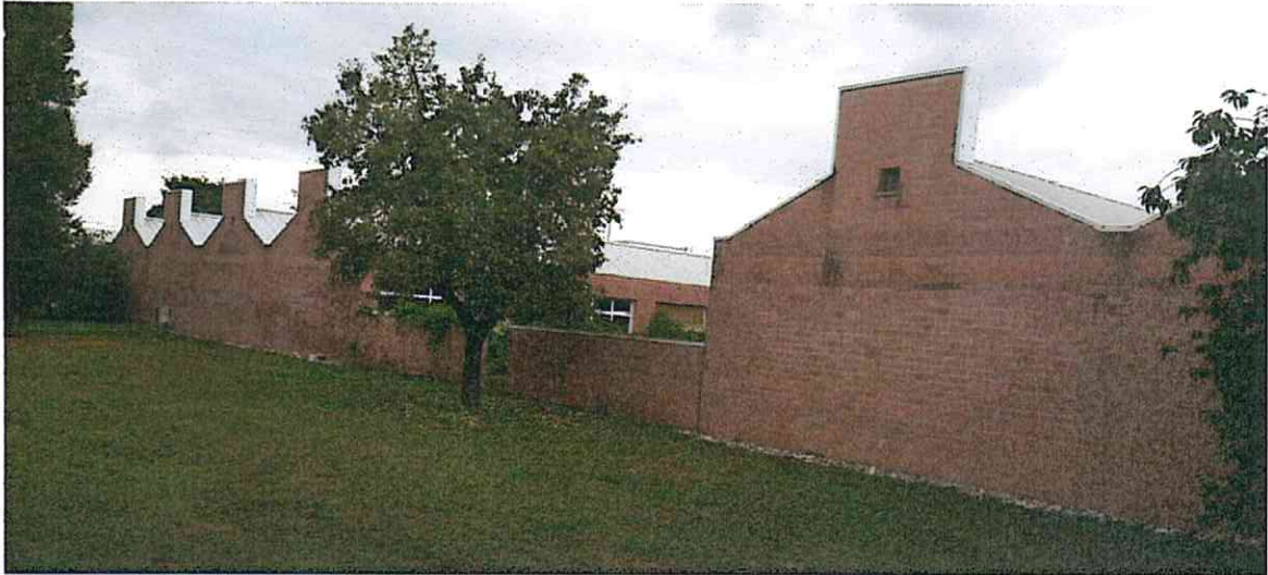
VISTA SUD – UNITA' ACCORPATE