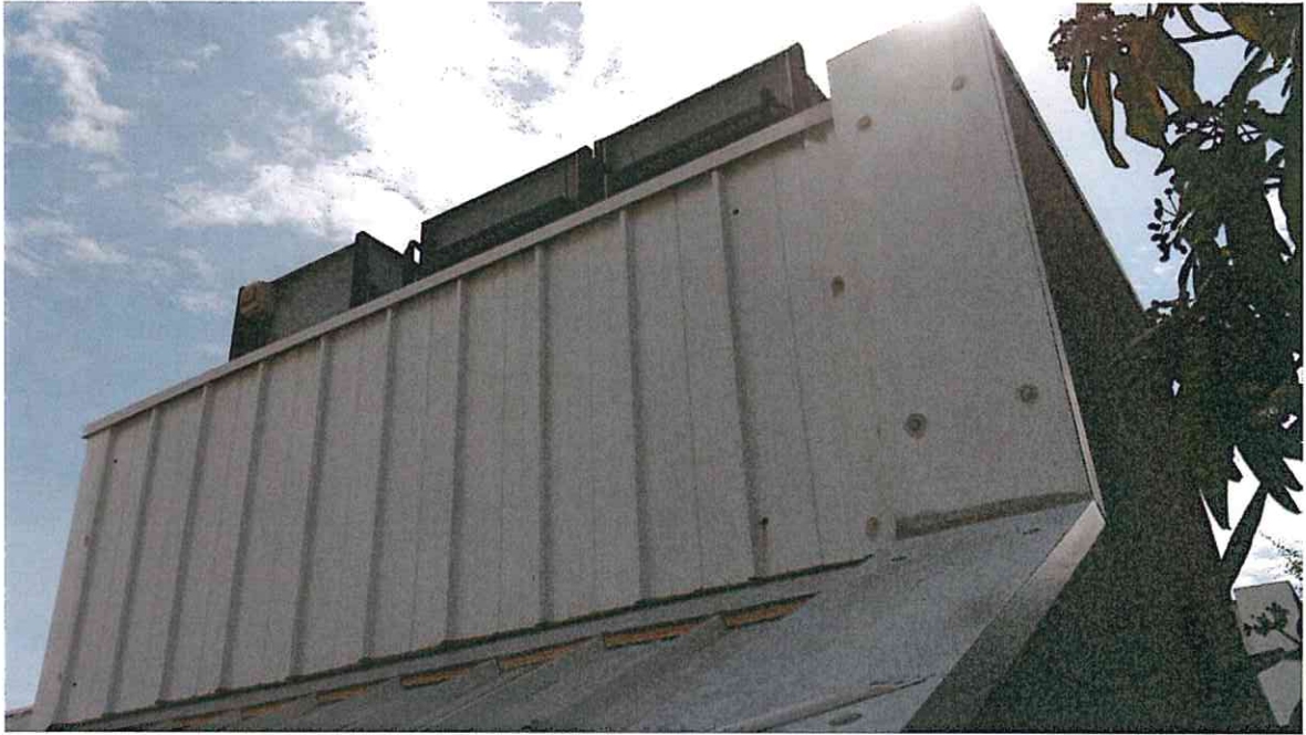
TORRETTA E SCOSSALINA SU TESTATA MURATURA