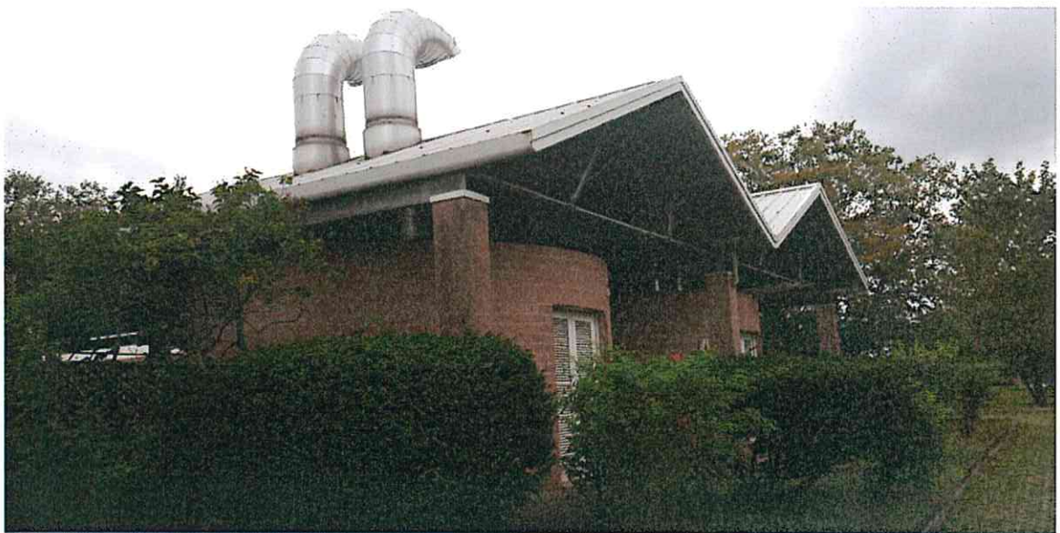
CORPO APERTO ZONA INGRESSO - VISTA LATO NORD