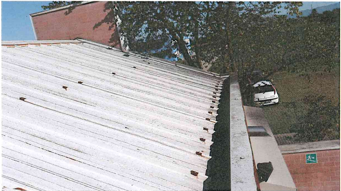
FALDA CON CANALE DI GRONDA