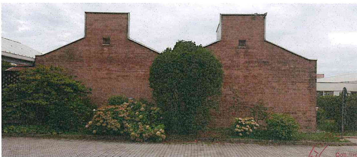
IMMOBILI LATO NORD