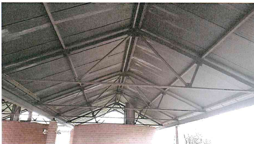
VISTA INTERNA CORPO APERTO ZONA INGRESSO