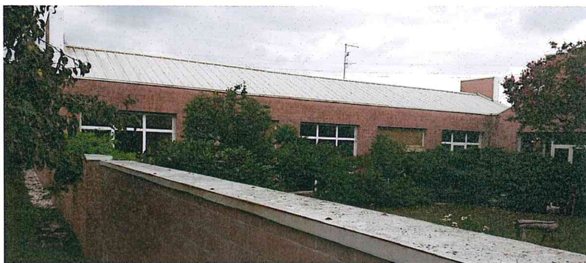
VISTA UNITA' INTERNA LATO EST