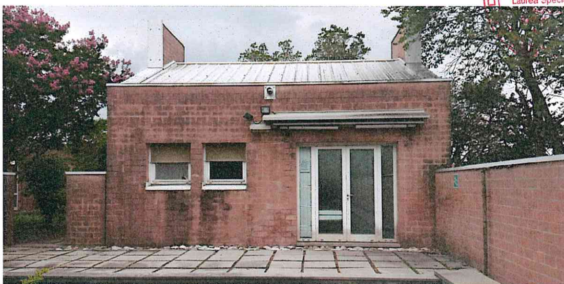
UNITA' SINGOLA LATO EST