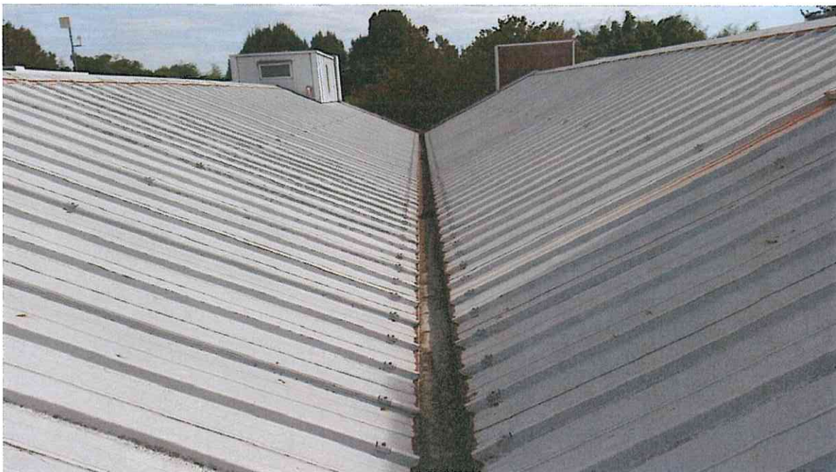
FALDE E COMPLUVIO